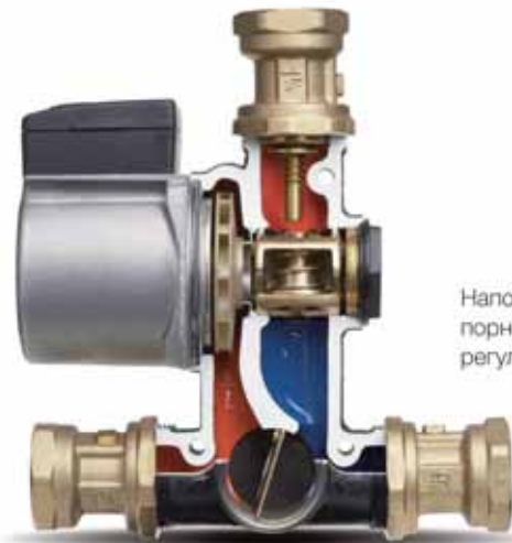
Напорного/безнапорного типа, простая регулировка расхода