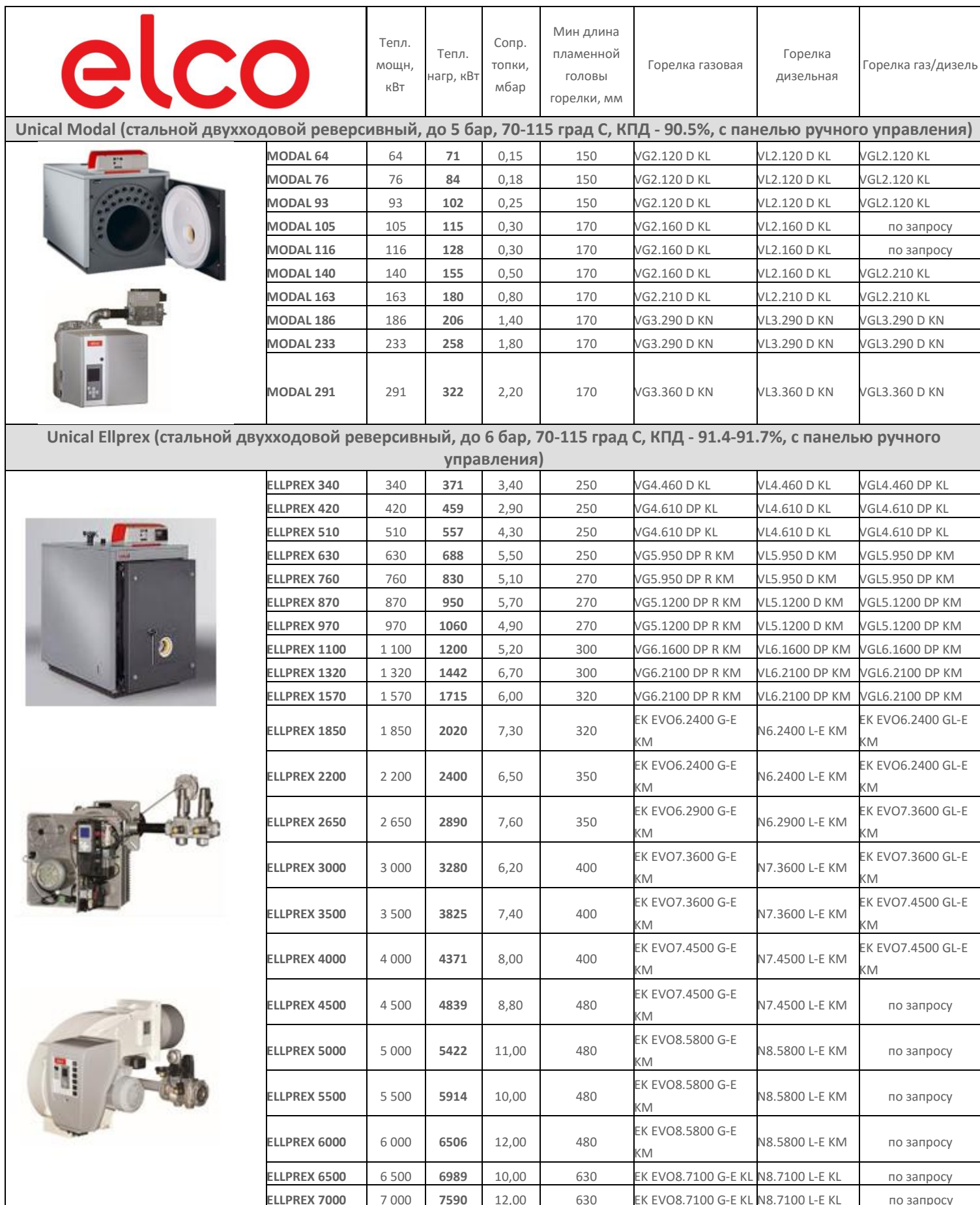
Таблица предварительного подбора горелок ELCO к котлам UNICAL